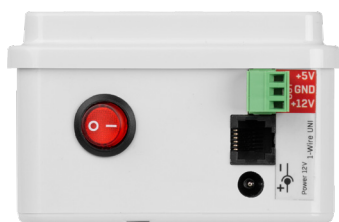
UPS 12V and 5V